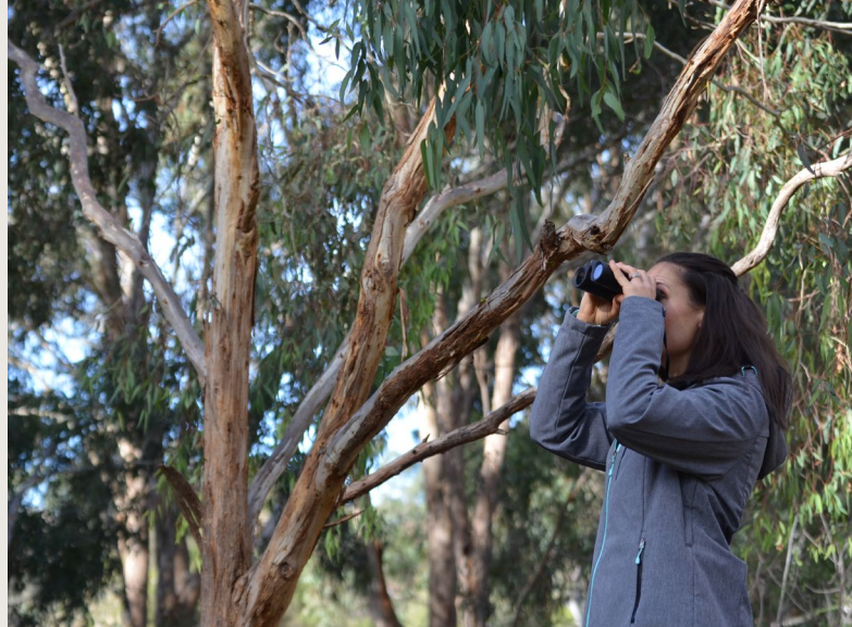
與城市生態學家Jacinta Humphrey博士一起

瞭解更多資訊，查看維多利亞鳥類俯衝事發地圖 www.monash.vic.gov.au/swooping-birds