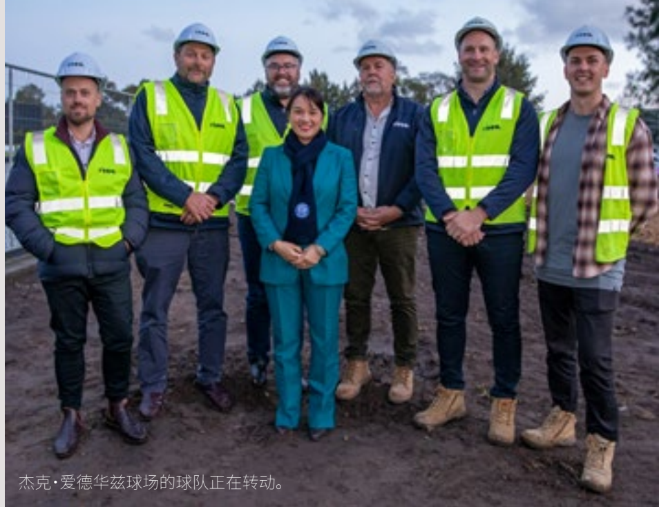
杰克·爱德华兹球场的球队正在转动。

和往常一样，本期《公报》有大量本市的新闻动态。比如在 Carlson Reserve 保护区，我们建成了多功能球场，韦弗利山体育馆正式开工，并在万众期