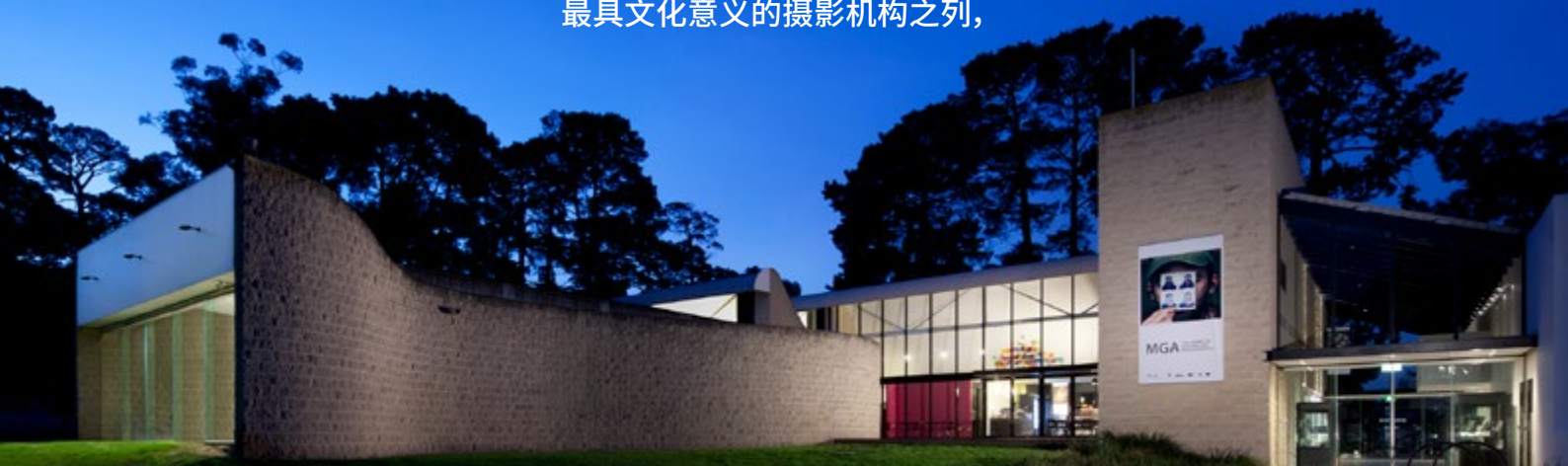
图片：2013 年的蒙纳士市美术馆(Monash Gallery of Art)。Brendan Finn