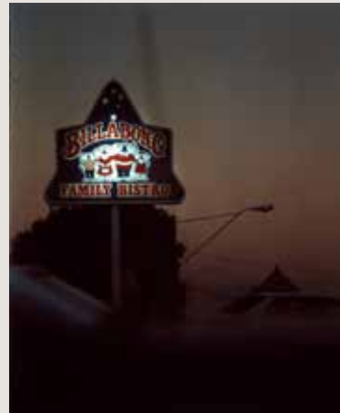
Bill HENSON《无题73》1985-86 来自《无题 1985-86》系列