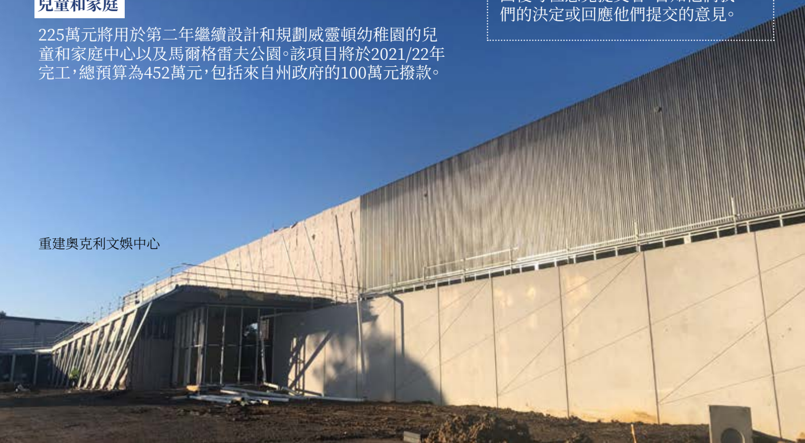
重建奧克利文娛中心

除非法律規定或授權，否則市議會不會在未經你同意的情況下，將你的個人資料作任何其它用途，亦不會透露相關資料。查閱我們的隱私權政策，請訪問 🌐 www.monash.vic.gov.au/privacy 考慮全部回饋意見後，市議會將在8月25日(週二)的例會上決定最終的預算案。我們將回復每位意見提交者，告知他們我們的決定或回應他們提交的意見。