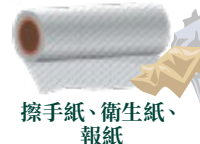
擦手紙、衛生紙、報紙