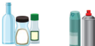
玻璃瓶、玻璃罐(連蓋)