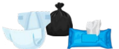
紙尿褲、嬰兒濕巾、寵物糞便、失禁墊、衛生用品(包好)