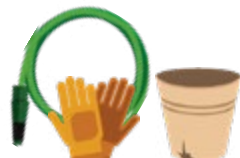
手套, 塑料盆栽、花園澆水用軟管