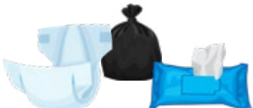
纸尿裤、婴儿湿巾、宠物粪便、失禁垫、卫生用品(包好)