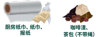
厨房纸巾、纸巾、报纸